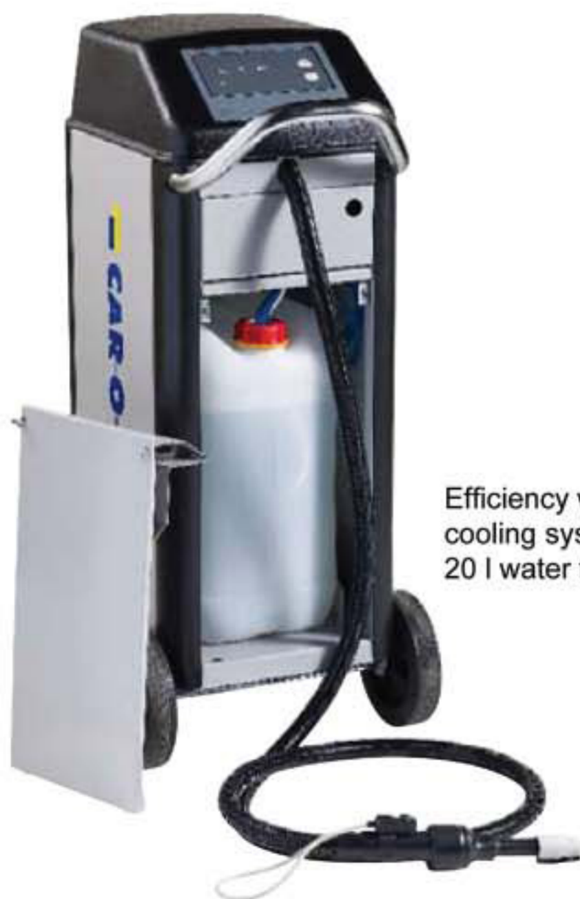
Efficiency water cooling system by 20 l water tank.