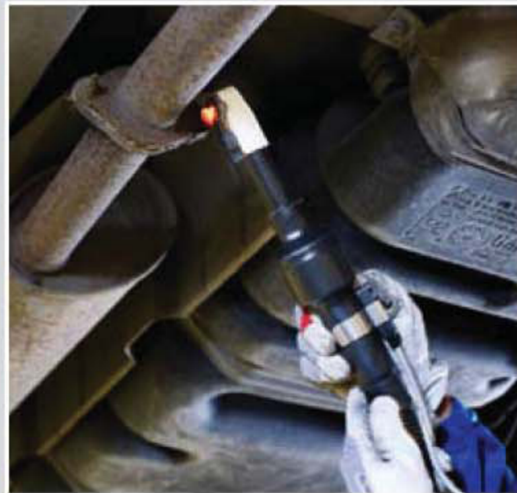
Heat rusted nuts and bolts on suspension, steering and exhaust.