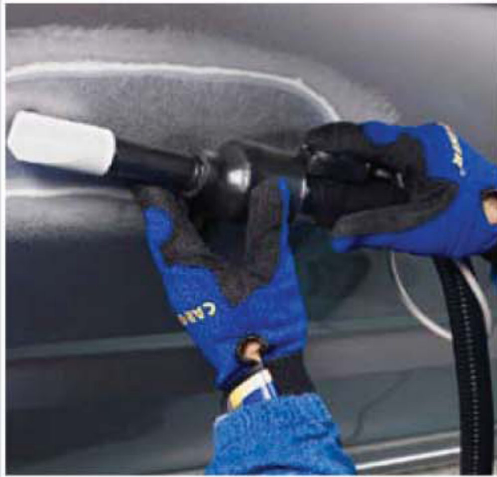
Heat shrinking of steel and aluminum panels during repair