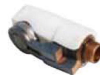
Angled induction head (standard).