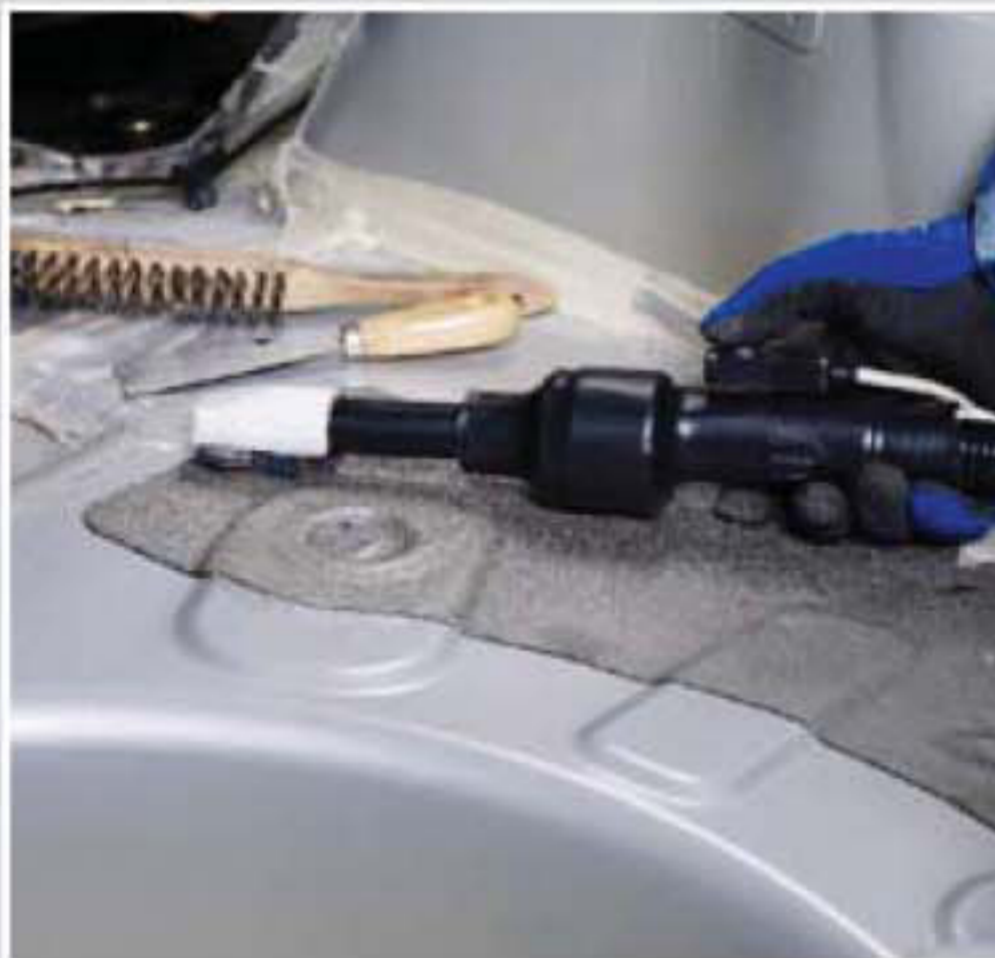
Heats through rubber or plastic.